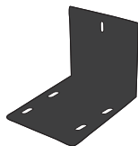
壁付け金具 4スクリュー 4× 40mm 4プラグ 6× 40mm 三脚1台 UNCスクリュー